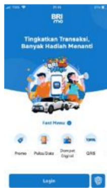
Gambar 3. Contoh Aplikasi Tabungan Berbasis Teknologi