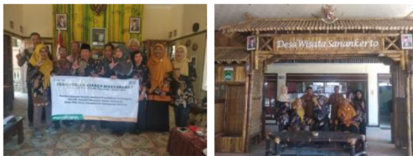
Gambar 4. Photo Tim Pengabdian STIE Indocakti Malang